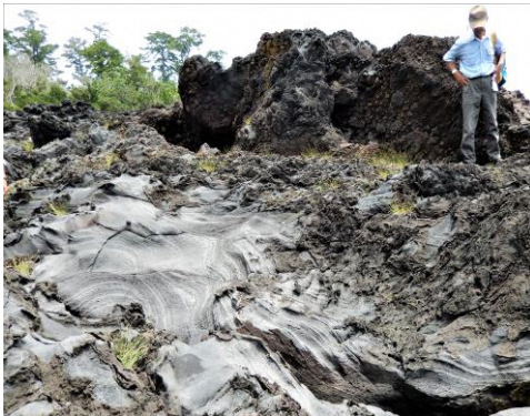
いがいが根の溶岩