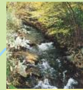
対島川 昔は大水の時だけ水が流れ、他の川のように海へ流れ込んでいなかったため「尻なし川」と呼ばれていました。