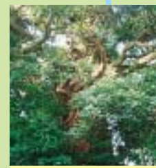
高見のシイの木 市指定文化財

この周辺には、美術館・博物館・ミュージアム・ギャラリー・陶芸体験・食事処喫茶等様々な施設が点在しています。