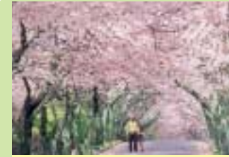
桜並木 ソメイヨシノの桜のトンネル、それは見事です。(4月上旬)