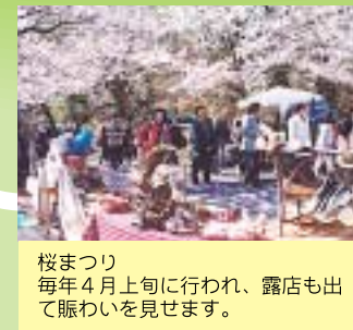
桜まつり 毎年4月上旬に行われ、露店も出て賑わいを見せます。